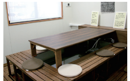
地域住民にも好評の炭酸泉の足湯

「スタッフの価値観を押し付けるのではなく、ご本人の思いを重視したい。いろいろな人の目があり、その人のことを話し合うことで“その人らしさ”を保てると思う。スタッフとケンカするくらい話し合っています」と笑う姿がかわいらしく、頼もしく見えます。